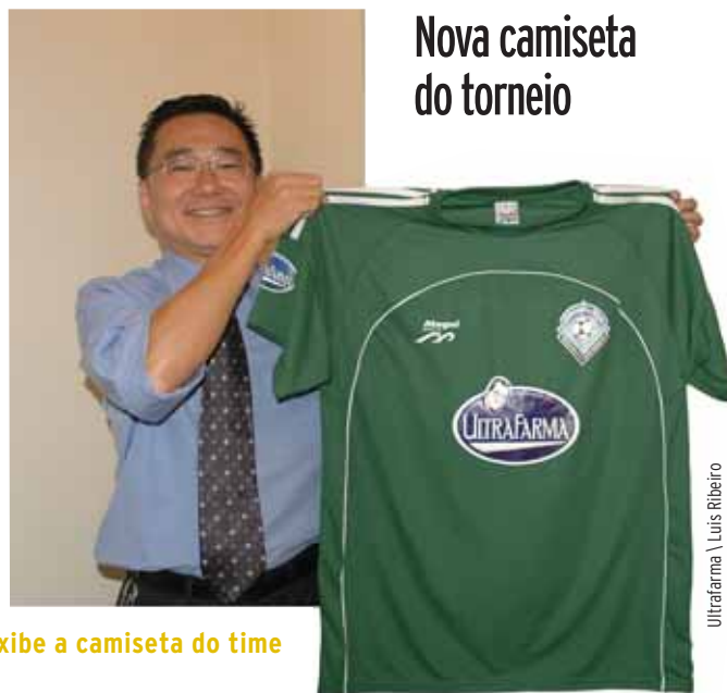
Ultrafarma \ Luis Ribeiro

Assim 11 times, com atletas de 28 a 60 anos: Corinthians, Santos, Palmeiras, São Paulo, Juventus, São Caetano, Lusa, Marília, Barueri, América e Rio