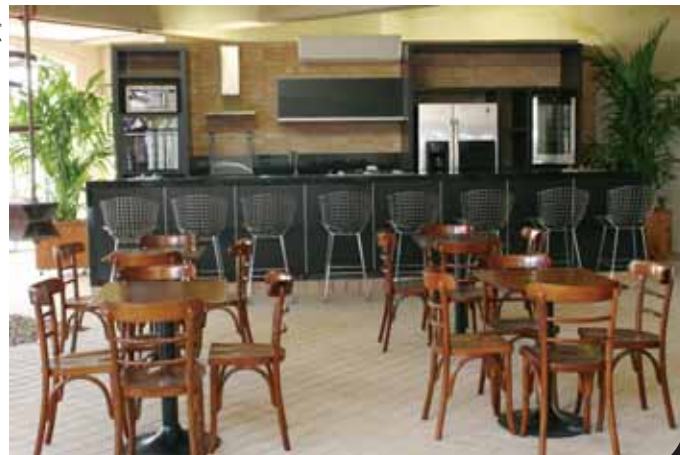
Piso superior de alimentação após a reforma.